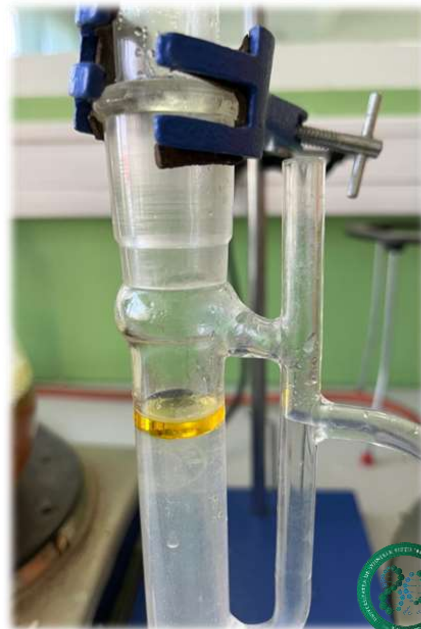
Ulei esențial de cimbru-Aetheroleum Thymi