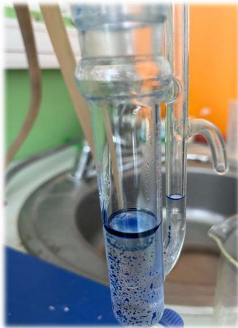
Ulei esențial de mușețel- Aetheroleum Chamomille