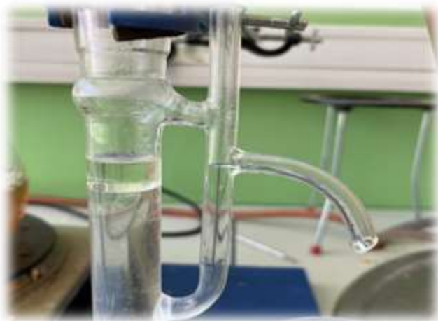
Ulei esențial de lavandă- Aetheroleum Lavandulae