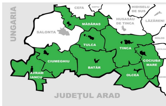
Figure 2.2. Map of the location of the communes bordering the town of Salonta

The main methods used are the quantitative and qualitative analyses based on data from official data sources, analyses based on the system of statistical indicators (multicriteria analysis) and field research.